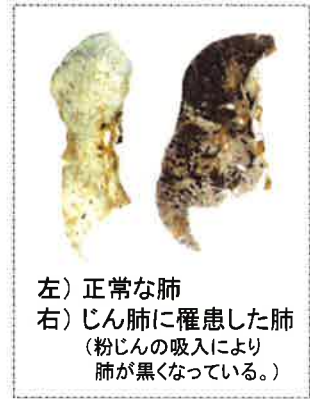
左) 正常な肺 右) じん肺に罹患した肺 (粉じんの吸入により肺が黒くなっている。)

現在、じん肺を治す根本的な治療がないため、じん肺にかからないための措置として、粉じんの発生源対策、局所排気装置等の適正な稼働、呼吸用保護具の適正な着用などにより、粉じんへの「ばく露防止対策」を徹底することが重要です。